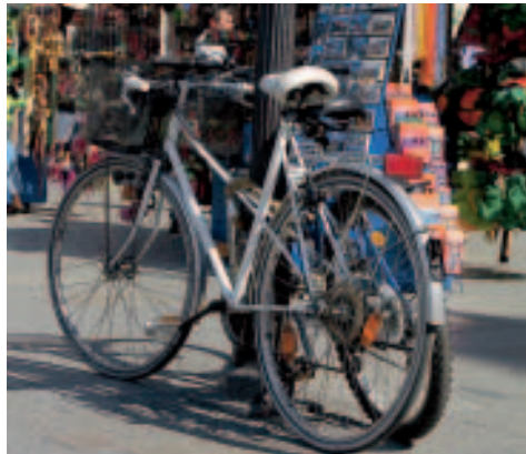
Krakau wird immer radlerfreundlicher

Cruising Krakow: Auf Englisch geführte Fahrradtouren durch die Stadt, die Umgebung und das Nachtleben. Preis 21 €, April bis Juni und Sept./Okt. Start tägl. um 12 Uhr, Juni bis Sept. um 11 Uhr, Dauer